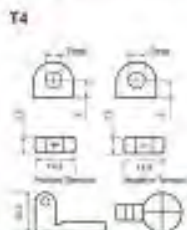
Schéma de montage des éléments